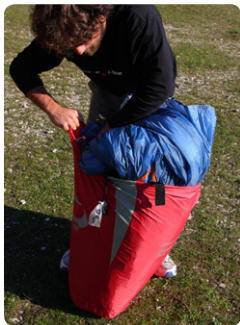
図7. 折りたたんだグライダーを、インナーバッグに収めます。

図6. プラスティックワイヤーを折り曲げないように グライダーを三つ折りあるいは四つ折りとします。