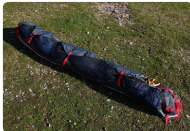
図9. コンチェルトパックを横向きにし、リーディングエッジ補強プラスチックのすぐ後ろでプラスチックを折り曲げないように注意しながら一折し、その後三つ折りあるいは四つ折りにします。