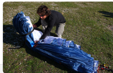
図6. プラスティックワイヤーを折り曲げないように グライダーを三つ折りあるいは四つ折りとします。

図5. リーディングエッジからトレーリングエッジま でが整頓されたら、グライダーを横向きにします。