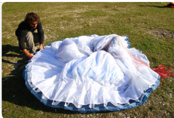
図2. Aライン取り付けタブを持って、プラスチックワイヤーが隣り合わせに重なるようにリーディングエッジ部分をひとまとめにします。

図1. ラインを絞ってマッシュルーム状になったグライダーを地面の上に置きます。グライダーを完全に展開した状態から、蛇腹折りをするとリーディングエッジ上面が地面と擦れるので、このマッシュルーム状からたたみ始めるのがベストです。