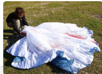
図3. ひとまとめになったリーディングエッジをバックアップベルトで固定します。グライダーをセンター部分で半分に折り重ねずに、翼端から翼端まですっかり蛇腹折りにします。真中のセルを無理に引っ張ったりプラスチックワイヤーを变形させたりしないように慎重に行ってください。

図2. Aライン取り付けタブを持って、プラスチックワイヤーが隣り合わせに重なるようにリーディングエッジ部分をひとまとめにします。