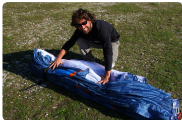
図5. リーディングエッジからトレーリングエッジま でが整頓されたら、グライダーを横向きにします。