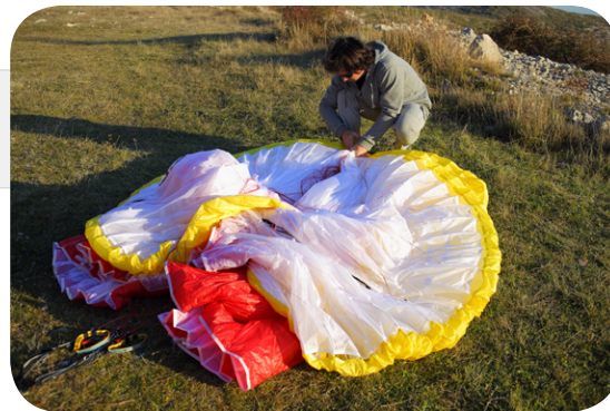
図1. ラインを絞ってマッシュルーム状になったグライダーを地面あるいはコンチェルトバックの上に置きます。グライダーを完全に展開した状態から、蛇腹折りをするとリーディングエッジ上面が地面と擦れるので、このマッシュルーム状からたたみ始めるのがベストです。

グライダーを出来るだけ長持ちさせ、かつリーディングエッジ補強用プラスチックワイヤーを出来るだけ良いコンディションに保つために、グライダーのたたみ方は慎重に行ってください。すべてのセルが互いに隣り合わせにたたまれ、プラスチックワイヤーが不必要に曲らないように、図のように蛇腹折り方法を使用することをお勧めします。付属のインフレーター折りたたみ枕を使用することもお勧めしますが、絶対に必要というわけではありませんが、前縁の折りたたみの角度が緩やかになり、プラスチックワイヤーを保持するのに役立ちます。折りたたみ枕は空気を抜いてハーネスに入れて運び出すことができます。またオゾン・コンチェルトバックを使用するとグライダーが長持ちし、かつグライダーのパッキングを素早く簡単に行うことができます。