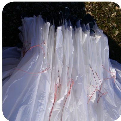
図2. Aライン取り付けタブを持って、プラスチックワイヤーが隣り合わせに重なるようにリーディングエッジ部分をひとまとめにします。グライダーをセンター部分で半分に折り重ねずに、翼端から翼端まですっきり蛇腹折りにしていることに注意してください。