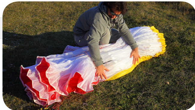
図4. リーディングエッジからトレーリングエッジまでが整頓されたら、グライダーを横向きにします。

図3. B,Cライン取り付けタブを利用してグライダーの中央から後方部分をひとまとめにします。