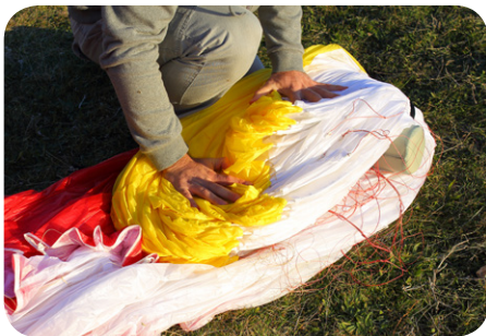
図5. 一折り目となりそうなあたりにフォールディング枕をおいて、リーディングエッジ側を折りたたみます。枕はたたむ角度を緩やかにしプラスチックワイヤーが曲がらない様に保護してくれます。次にトレーリングエッジ側をたたんだリーディングエッジの上に緩やかな角度で折り重ねます。