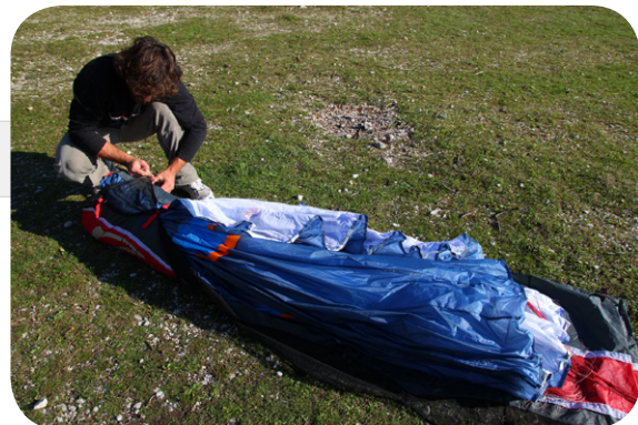
図8. フォールディング枕を適切な位置に置き、三つ折りでリーディングエッジとトレーリングエッジをたたみます。

図7. コンチェルトバックを使用してるならキャンピャーを挟み込まない様に注意しながらファスナーを閉めます。